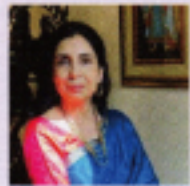
ナリニ・トシュニワル