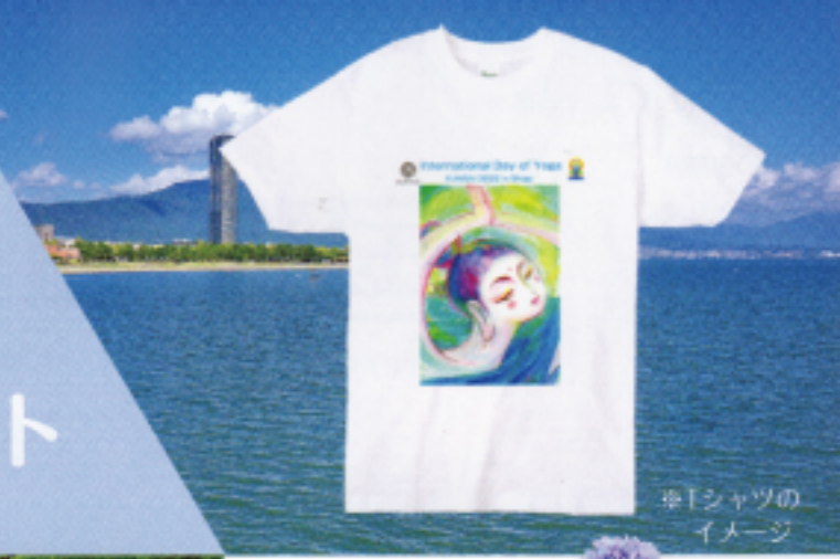
※Tシャツのイメージ