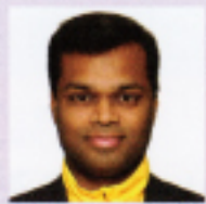
マスター・プラブジ