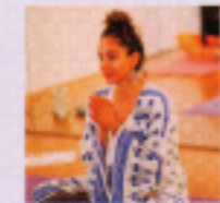
ブルビ・ジャベリ