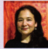
ナンシー・エンズリン